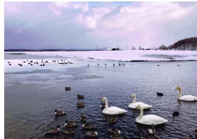
特別賞 旅たち前 齊藤喜代志 (山形県新庄市)