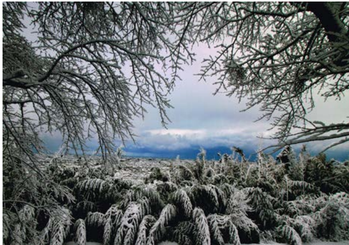
特別賞 降雪の朝 前田理一郎 (石川県白山市)