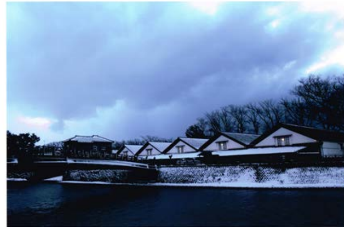
特別賞 泰然自若 新垣麻里 (沖縄県島尻郡与那原町)