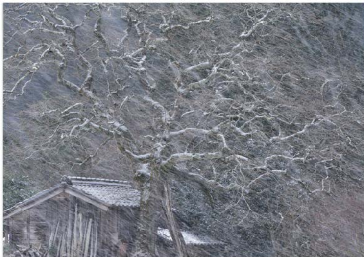
特別賞 喜雪風 田京敬康 (愛知県春日井市)