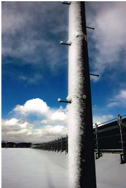
特別賞 吹雪後晴 豊岡守一 (山形県新庄市)