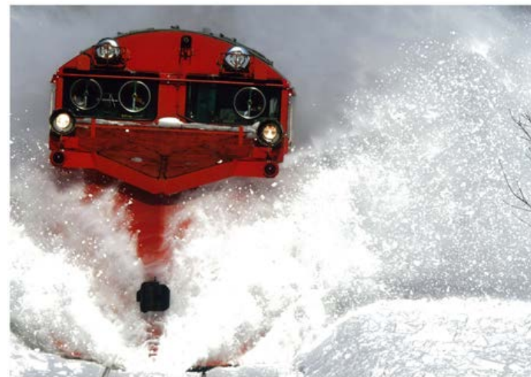
雪の里情報館 館長賞 除雪粉の舞 谷口清和（東京都豊島区）