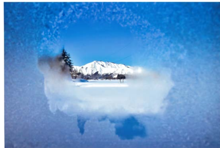
特別賞 -7度の朝 江部堅市 (新潟県南魚沼市)