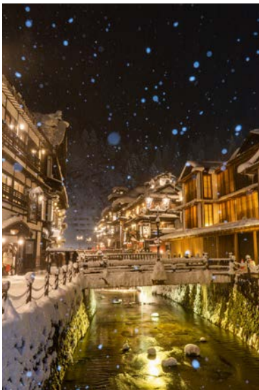
特別賞 暖かい煌めき 衛藤菜緒 (東京都小平市)