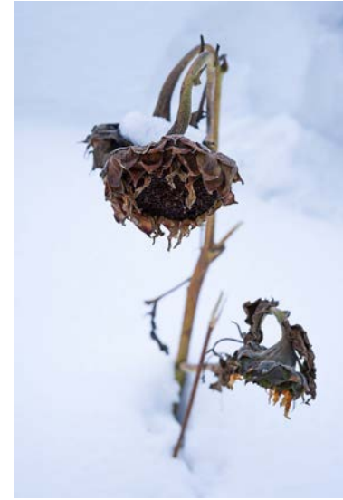
特別賞 雪の上に咲く夏の花 阿部凜花（新潟県新潟市）