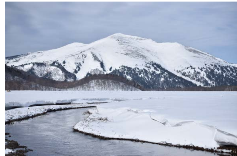
特別賞 尾瀬の白 本橋 篤（東京都武蔵野市）