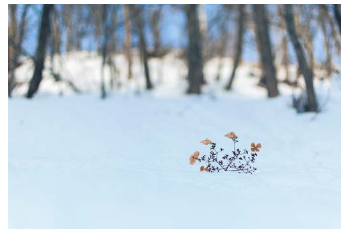
特別賞 越冬 西口悠斗（北海道札幌市）